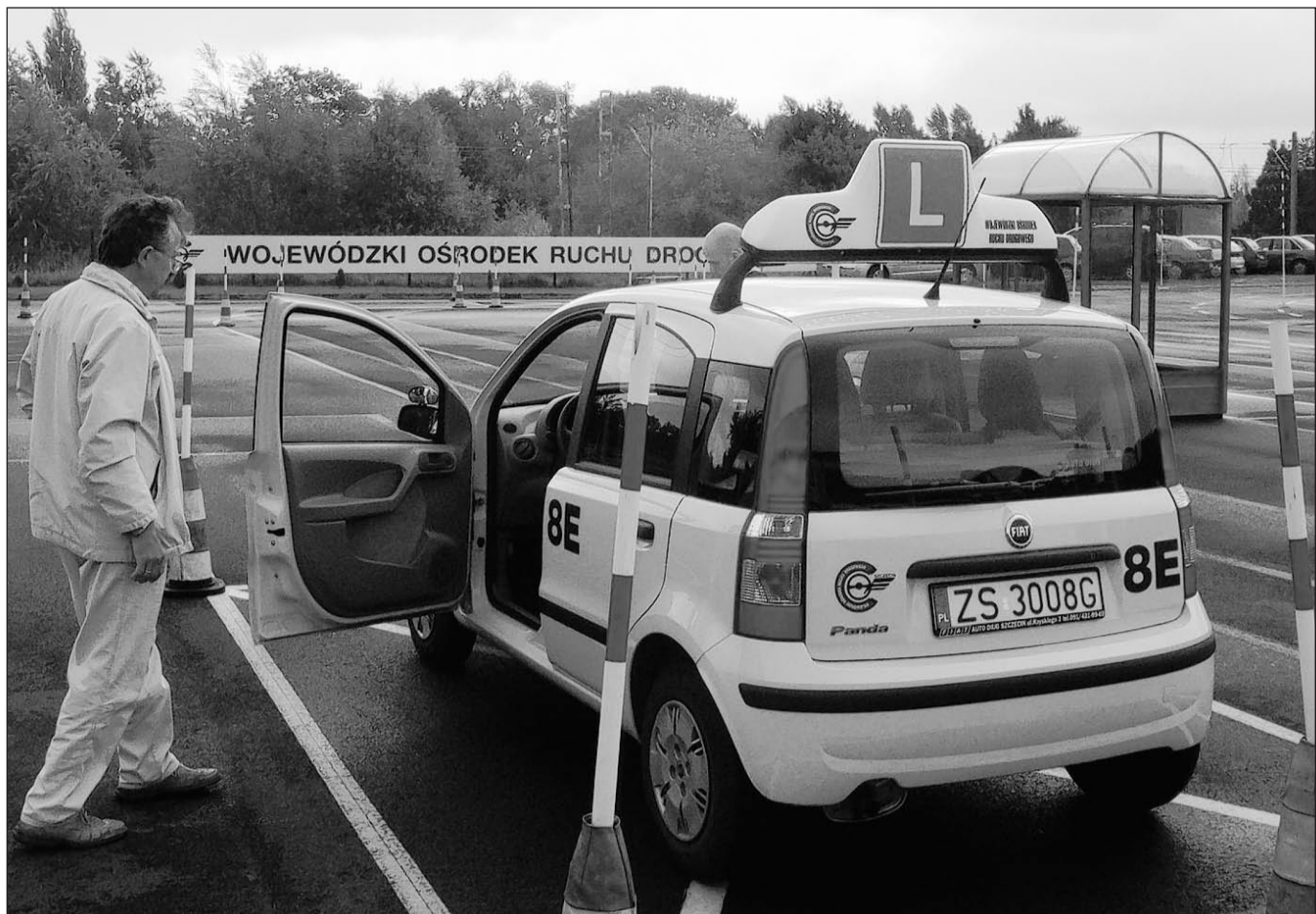
Fahrprüfung in Polen: Auf diesem Testgelände in Stettin haben in den vergangenen Jahren schon Tausende Deutsche einen Führerschein erworben.